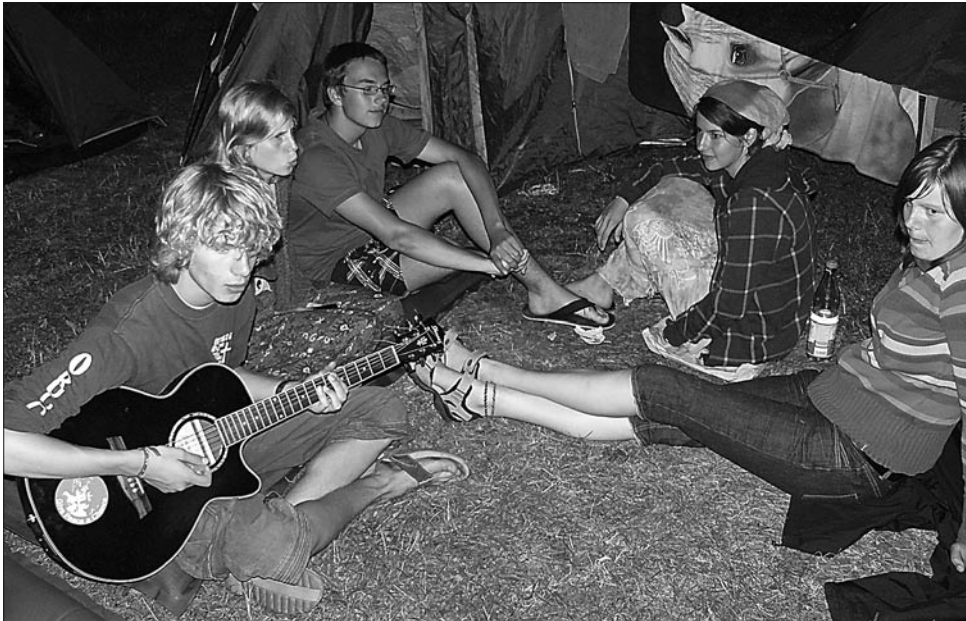
Auch in diesem Sommer waren Jugendliche aus unserer Propstei mit Malchinern gemeinsam in Taize

Redaktion: J. Utpatel, K. Spillner Herausgeber: verantwortlich Propst Jörg Utpatel im Auftrag des Kirchgemeinderates Neubukow und der Synode der Propstei Bukow Anschrift: Evang.-luth. Kirchgemeinde, Mühlenstraße 3, 18233 Neubukow, Telefon (03 82 94) 1 64 66 Gesamtherstellung: Druckerei Karl Keuer • E-Mail: druckerei@drukk.de • Tel. (03 82 94) 7 84 53