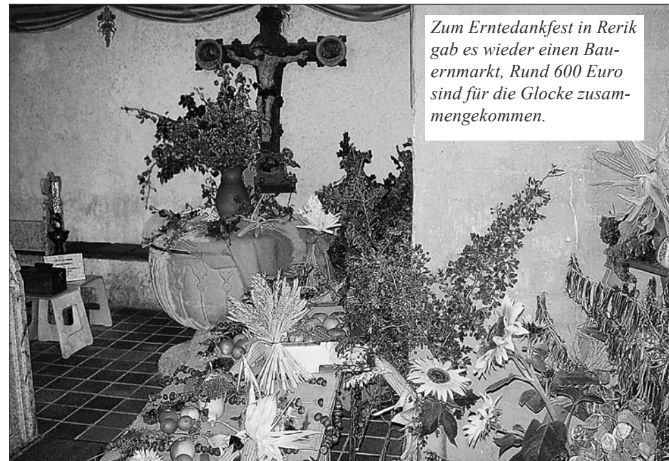
Zum Erntedankfest in Rerik gab es wieder einen Bauernmarkt, Rund 600 Euro sind für die Glocke zusammengekommen.