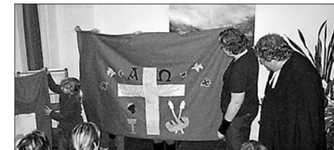
Der Kinderbibeltag hat neue Antependien für den Altar in der Neuburger Kirche gebastelt.

stei wurden aufgefüllt. Es müssen noch weitere Arbeiten folgen, aber es ist auch schon viel geschehen. Ganz herzlichen Dank an die Firma BQG Neptun, an die tatkräftigen Mitarbeiter und an Herrn Jenjahn vom Kirchgemeinderat.