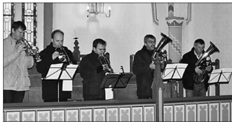
Der Neubukower Posaunenchor am Heiligabend

Nach sechs Jahren wird der Kirchengemeinderat auch in Neubukow und Westenbrügge neu gewählt. Dazu braucht jede Gemeinde Ihre Hilfe. Bitte überlegen Sie doch mit, wer dafür vorgeschlagen werden könnte – es ist ein Missverständnis, dass „Kirchenälteste“ alt sein müssen! Wählbar ist jedes Gemeindeglied ab 18 Jahren. Bitte, machen Sie mit – lesen Sie dazu auch Seite 4.