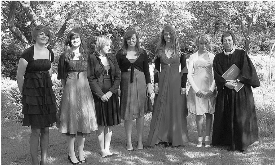
Pfingsten wurden sechs Konfirmandinnen konfirmiert