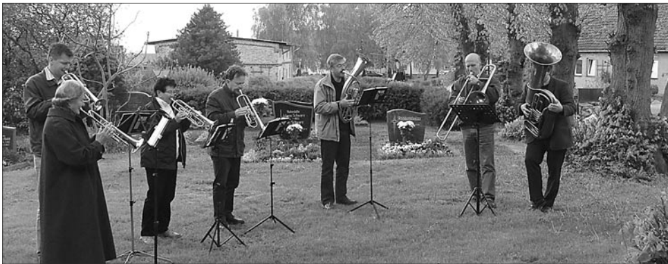
Bläserchor aus Neubukow und Rerik