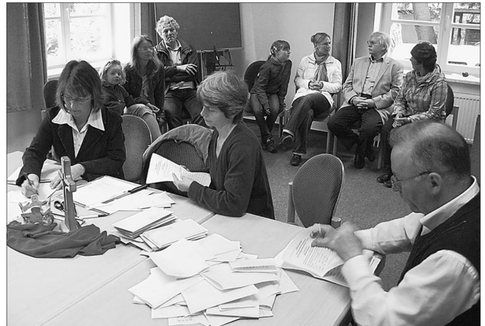
Auszählung der Stimmen in Neubukow am 30. Mai

Wir danken allen KandidatInnen und WählerInnen für die Beteiligung an der Wahl. Auch dem Wahlausschuß unter Leitung von Barbara Kotlarski gebührt herzlicher Dank. Am 22. 8. (Neubukow) und am 12. 9. (Westenbrügge) werden die neuen Kirchengemeinderäte eingeführt werden.