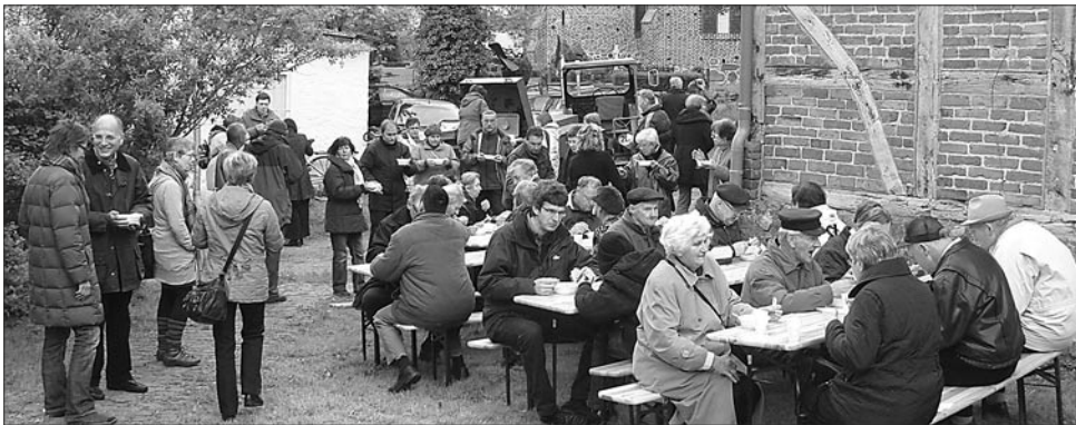
Gemeinschaft bei Suppe und Brot