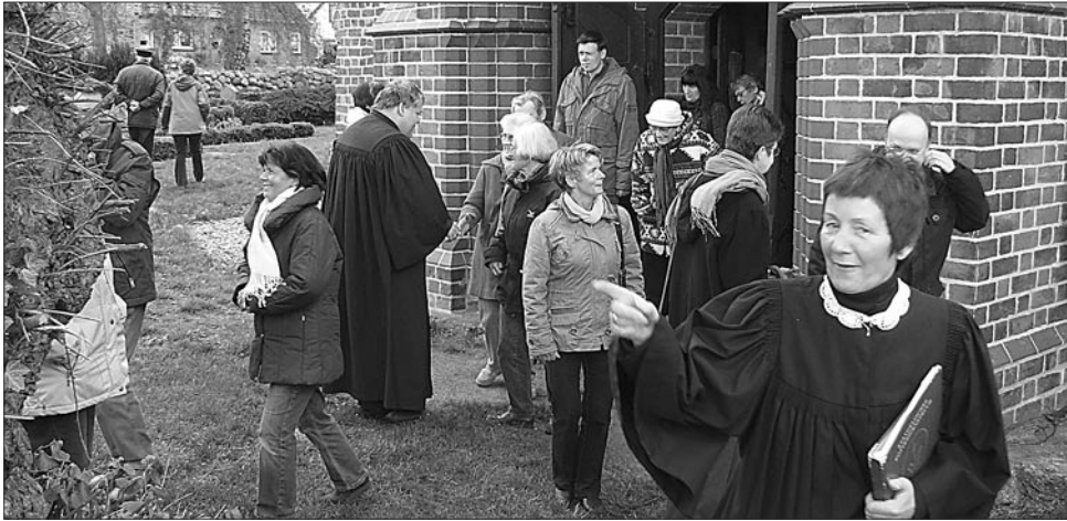
Fröhliche Gesichter nach dem Propstei-Gottesdienst zu Himmelfahrt in Russow