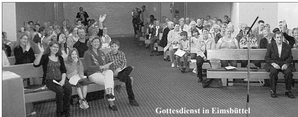
Gottesdienst in Eimsbüttel

Wetter eine tolle Aussicht auf Hamburg gab. Nach einiger freier Zeit, die zum Spaziergehen, Kaffeetrinken u.ä. genutzt wurde, ging es zur Alt Bukower Partnergemeinde. Dort aßen wir zusammen Abendbrot und ließen die Partnerschaft wieder neu aufleben. Kurz nach 20 Uhr waren wir wieder alle zu Hause angekommen, fröhlich und geschafft, also, bis zum nächsten Ausflug!