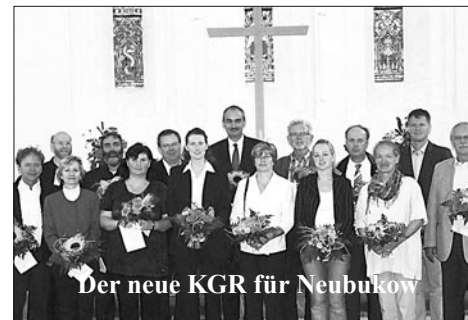
Der neue KGR für Neubukow

Im August/September wurden in Neubukow und Westenbrügge die neuen Kirchengemeinderäte eingeführt. Um die künftige Struktur der Arbeiten zu beraten, fanden die ersten Sitzungen der Gremien bereits statt. Zum 2. Vorsitzenden des Neubukower