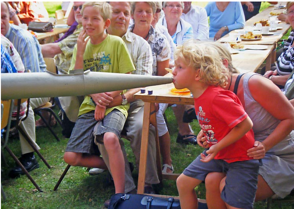
Der Neubukower Posaunenchor sucht neue Mitglieder – wir möchten es jungen oder älteren Interessenten ermöglichen, ein Instrument (Trompete, Flöte ...) zu erlernen. Bitte meldet Euch!

Es grüßt Sie herzlich Ihre Redaktionsgruppe