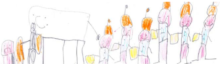
Emil (6 Jahre), Dreveskirchen

in der Kirche, Laternenumzug zum Feuerwehrhaus, Martinsfeuer und Würstchen