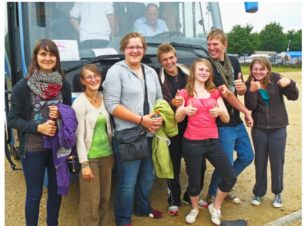
Die Jugendgruppe aus der Propstei in Taizé – kurz vor der Rückfahrt