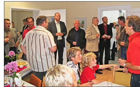
Eröffnung am 19. August 2011

Die Räume sind freundlich eingerichtet, die Küche ist komplett, viele fleißige Hände rühren sich, auch Spenden aus manchem Garten kommen herein – man merkt, dass dieses Begegnungs- und Sättigungsangebot für Leib und Seele gern angenommen wird.