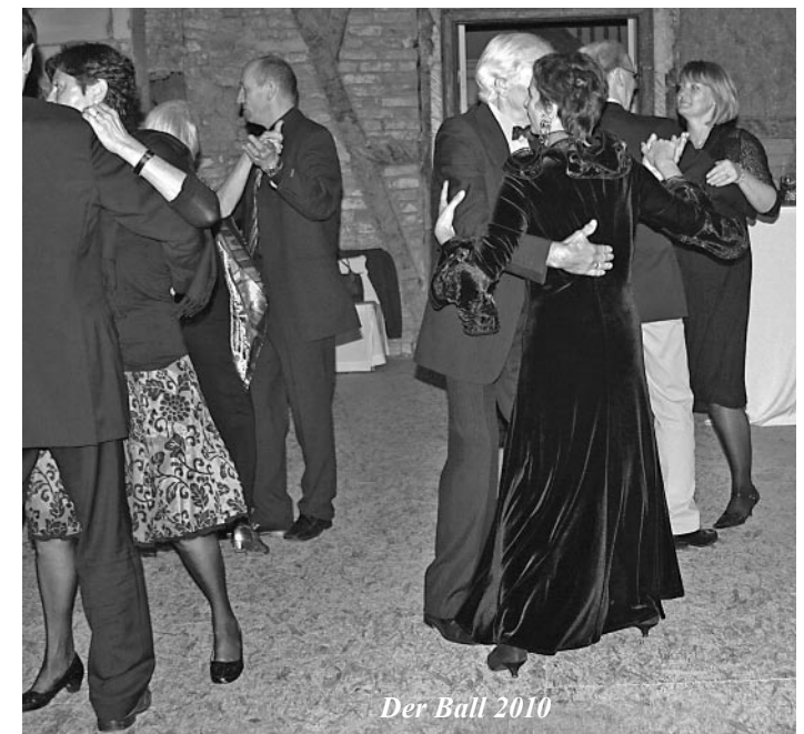
Der Ball 2010

Barz um 19.30 Büttelkow 6.10. Die Lesung – Zwei Stimmen 19.30 Uhr AWO SANO 7.10. Das Tanzbein – Schritte für den Ball 19.30 Roggow / Herrenhaus; 8.10. Der Ball – Tanzabend im Herrenhaus Roggow; 10.10. Die Sieben im Turm – Ausstellung und Darbietung von regionalen Künstlern um 19.30 Kirchturm Rerik 12.10. Das Finale – Filmabend anschließend Gespräch und Wein um 19 Uhr AWO SANO Weitere Informationen unter www.sanisibar-rerik.de und in unseren Schaukästen.