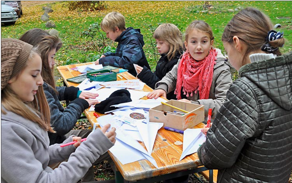
Propsteigottesdienst in Biendorf am 31. Oktober. Die Kinder basteln Papierflieger mit Segenswünschen (Foto: D.-M. Kross)

Redaktion: J. Utpatel, K. Spillner Herausgeber: verantwortlich Propst Jörg Utpatel im Auftrag des Kirchgemeinderates Neubukow und der Synode der Propstei Bukow Anschrift: Evang.-luth. Kirchgemeinde, Mühlenstraße 3, 18233 Neubukow, Telefon (03 82 94) 1 64 66 Titelbild: Sindy Altenburg Gesamtherstellung: Druckerei Karl Keuer • E-Mail: druckerei@drukk.de • Tel. (03 82 94) 7 84 53